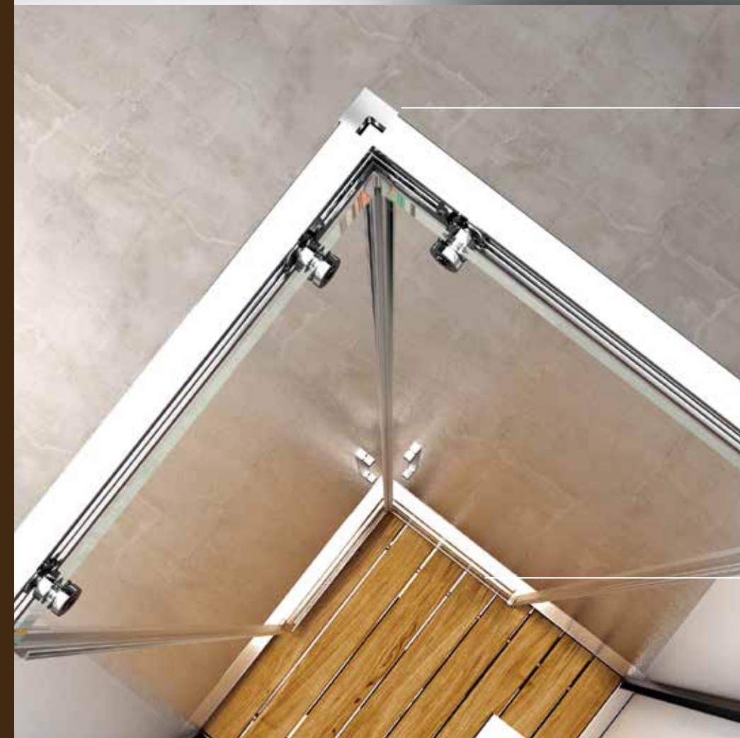
Elemento angolare in Ottone pieno con cromatura manuale Angular element in full brass with manual 20 Micron -thick chromium plating