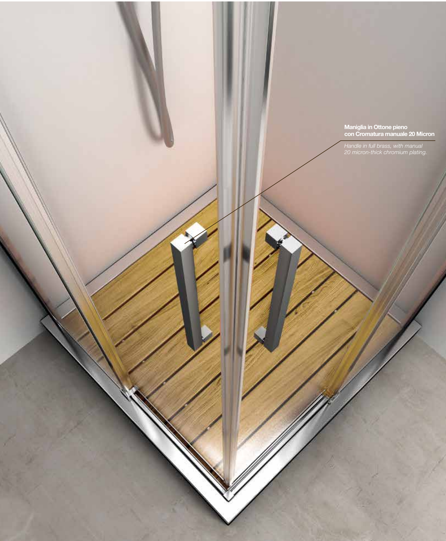
Maniglia in Ottone pieno con Cromatura manuale 20 Micron Handle in full brass, with manual 20 micron-thick chromium plating.