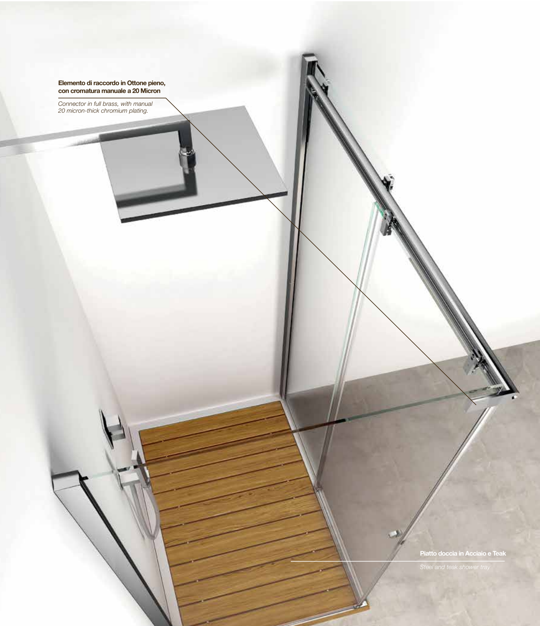
Elemento di raccordo in Ottone pieno, con cromatura manuale a 20 Micron

Connector in full brass, with manual 20 micron-thick chromium plating.